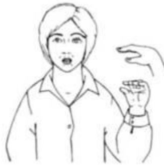
Ручная поза звука [у] «Трубочка»