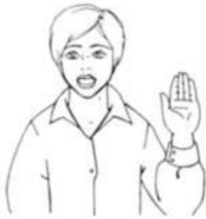
Ручная поза звука [а] «Окошко»