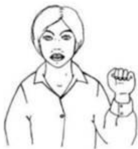
Ручная поза звука [ы]