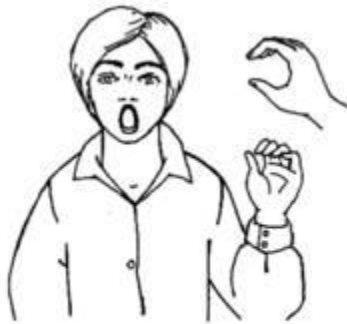
Рис. 3. Ручная поза звука [о] «Хоботок»