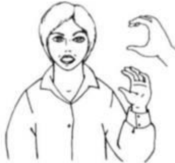
Ручная поза звука [э]