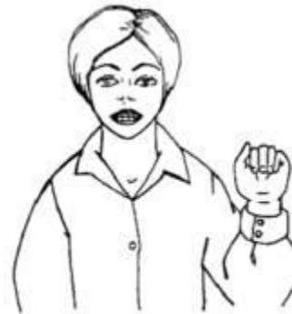
Рис. 4. Ручная поза звука [и] «Заборчик»